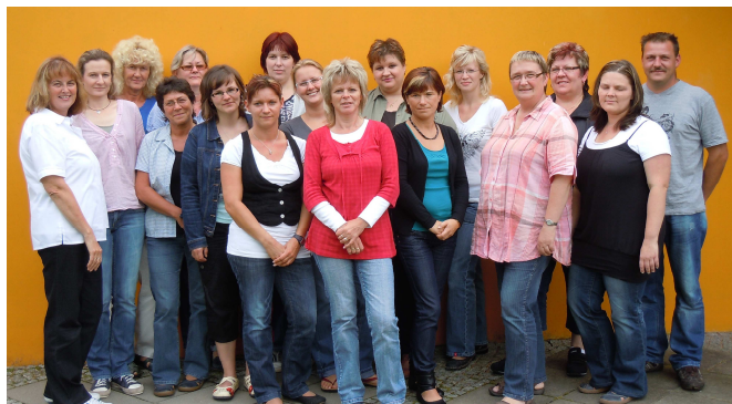
Das Team der MSU

Stettiner Straße 127, 17291 Prenzlau Telefon: 03984 2270, Fax: 03984 830813 Homepage: www.msu-uckermark.de E-Mail: kontakt@msu-uckermark.de